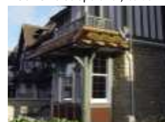
2 Houlgate, Normandie