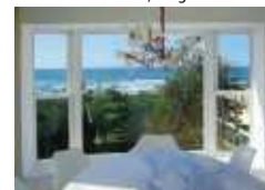
5 Golf de Chiberta, Anglet*

*Architectes, PQuiquampoix & J.M. Roques