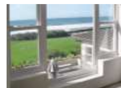
3 Golf de Chiberta, Anglet*