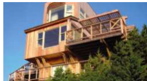
1 Domaine de Spérone*, Corse

Remises aux normes, amélioration de l'accueil, de la convivialité, des échanges... tout est pensé pour le bien être des résidents et du personnel de l'établissement datant des années 60. Le pari de l'architecte Jean-Christophe BALLET, Agence Ivars & Ballet Architectes, est de « suggérer symboliquement la possibilité d'une coexistence enrichissante entre deux époques tout en proposant une lecture harmonieuse d'ensemble, douce et reposante, en accord avec le site ». Le travail architectural sur les formes, les textures et les matériaux confère à l'ensemble une image forte et identifiable. Le traitement des façades joue de l'horizontalité pour retrouver une échelle humaine : Le bardage Duracolor® y contribue et le coloris choisi, le blanc, met en avant l'esprit nature des loggias et terrasses dont les pensionnaires bénéficient. Rendez-vous est pris en 2010 pour la réception définitive des