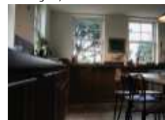
4 Arzon, Bretagne